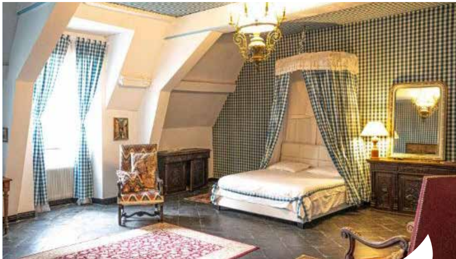
© Bénédicte Truchard - Château du Boschet

Découvrez le charme et la majesté de deux châteaux emblématiques qui vous ouvrent leurs portes pour une expérience inoubliable. Plongez dans l'histoire et l'élégance de ces lieux d'exception et laissez-vous séduire par une programmation riche en découvertes et en émotions.